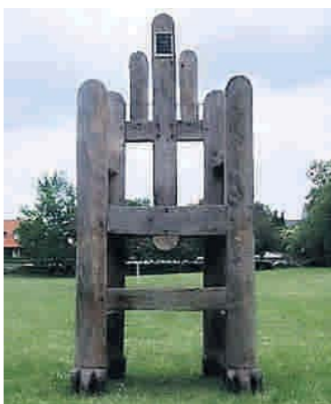
Udo Havekost: Thron zum 70. Geburtstag von Joseph Beuys . 2.80 meter eikenhout.

17.00 uur Afsluiting met 'Letztes Glas im Stehen' voor de deelnemers. Meer info op: www.istdas-typisch-deutsch.de .